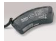
Speedcharger Belt-Pack® 12/4.5